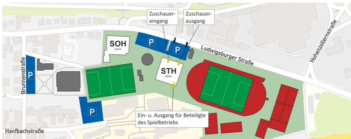
Abbildung 1: Übersichtskarte Stadionhalle und Sonnenbrunnenhalle Möglingen

Bei Positivtestung ist unverzüglich der Vorstand des Vereins, der Hygienebeauftragte, sowie das Landratsamt und das Gesundheitsamt zu informieren.