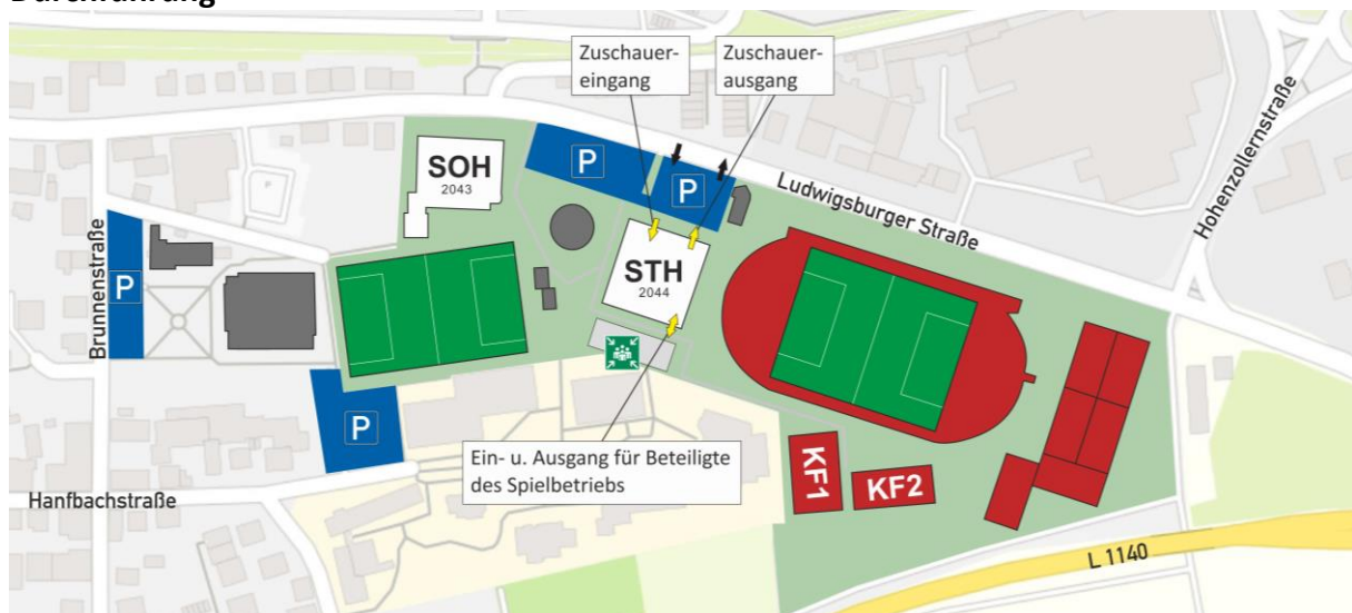
Abbildung 1: Übersichtskarte Sportgelände Möglingen

Die Spiele des Jugendturniers finden ausschließlich in der Stadionhalle (STH) statt. Während des Turniers betreten nur die beiden spielenden Mannschaften den Halleninnenraum. Die weiteren Mannschaften halten sich vor den Spielen bzw. in den Pausen außerhalb der Stadionhalle, entweder auf dem Sammelplatz hinter der Stadionhalle, auf den Kleinfeldern (KF1 und KF2) oder in der Sonnenbrunnenhalle (SOH) auf (s. Abbildung 1-2). Dort ist das Warmlaufen bzw. Einspielen in beschränktem Umfang und unter Berücksichtigung der anderen Mannschaften möglich.